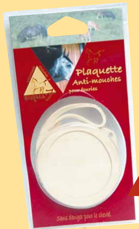
Blister étanche de 2 plaquettes

Une plaquette suffit à protéger le volume d'un box.