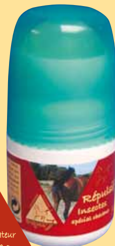
applicateur de 70 g

Permet une application précise aux endroits sensibles aux insectes.