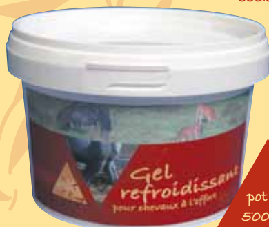
pot de 500 ml

Ce gel ne contient ni camphre, ni menthol ni autre substance pouvant réagir aux tests anti-dopage.