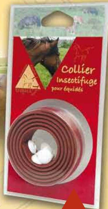
Blister étanche de 1 collier