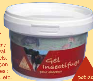
pot de 500 ml

La présentation en gel permet de traiter ponctuellement et de façon économique les parties les plus exposées aux mouches : tour des yeux, des oreilles, anus, vulve, fourreau ...etc.