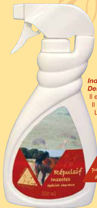
pulvérisateur de 500 mL

Le laboratoire AB7 Industries Vétérinaires propose plusieurs spécialités destinées à lutter contre ces insectes indésirables et qui ne présentent pas les inconvénients des produits traditionnels (odeurs).